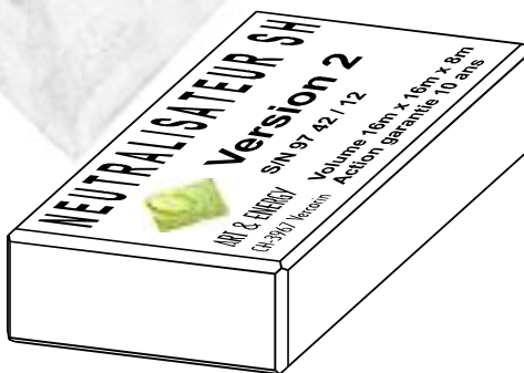
NEUTRALISATEUR SH pour l'habitat

Ce sont sur ces principes que nous avons développé ce que nous appelons le « NEUTRALISATEUR SH », petite pièce en bois prismatique ou sous forme de carte de crédit, qui renferme dans la matière dense les « informations » ou le « programme » de compensation des énergies subtiles terrestres par les énergies subtiles cosmiques, agissant dans un volume couvrant tout l'habitat, de manière dynamique et ceci durablement dans le temps. Le NEUTRALISATEUR SH n'a rien à voir avec la magie mais est une application pratique de la science qui, nous l'espérons, prévaudra le prochain millénaire. Du fait que le NEUTRALISATEUR SH ne comporte aucune pièce mécanique ou électronique, il ne nécessite aucun entretien et d'autre part, il peut être produit très économiquement et ainsi accessible à chacun et trouver place dans chaque habitation !